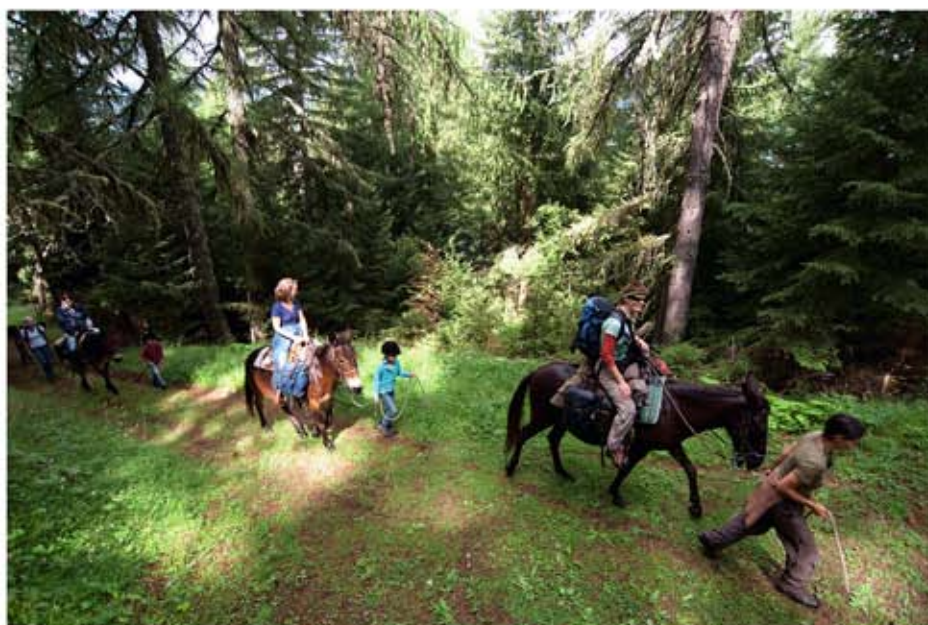
Een muil dier loopt bergop even hard als op de vlakke weg.

Het zou een makkie worden dachten we, gewoon achter de muil dieren aanlopen