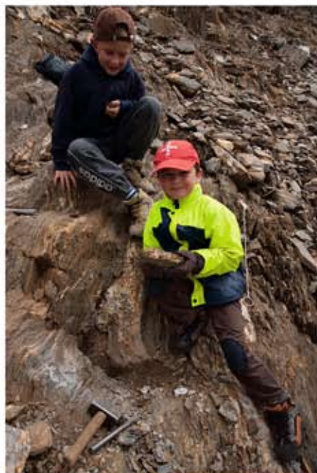
Gek genoeg vinden de kinderen meer mineralen dan wij.