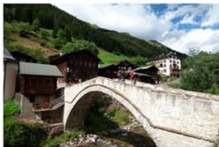
I Het mooie dorpje Binn.