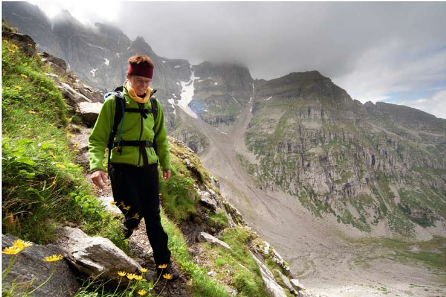
I Het pad op de afdaling van de Ritterpass is steil, smal en prachtig mooi.

die volgens de boeken veertig of vijftig miljoen jaar geleden zijn ontstaan. Of zou in de toekomst blijken dat het ook tien miljoen jaar eerder of later kan zijn?