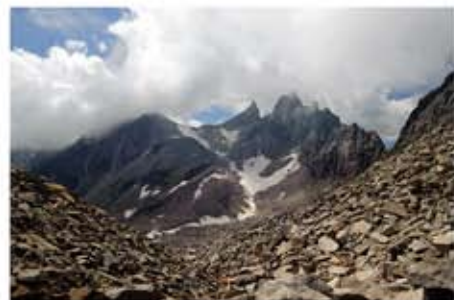
I De Schinhörner.

Kompass, Domodossola, WK89, 1:50.000. Alleen nodig voor het Italiaanse deel van de tocht naar de Albrunpass. Rottenverlag, Binnental/Veglia-Dévero, 1:25.000. Gedetail-